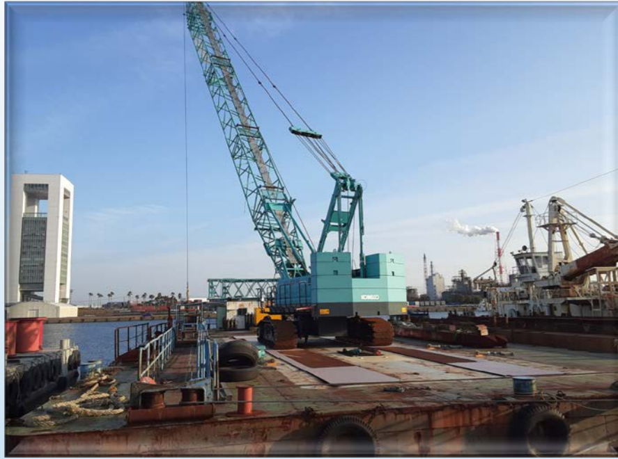
BM1000G(基礎工事に用100t吊クローラクレーン)